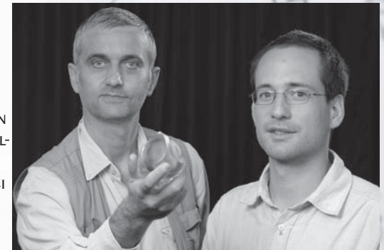
A Gömböc feltalálói

FELHASZNÁLÁS SZEMPONTJÁBÓL ELSŐDLEGESEN MINT DÍSZÍTŐ, ÉS MEDITÁCIÓS CÉL JÖHET SZÓBA. NEM A GÖMBÖC MATEMATIKAI DEFINÍCIÓJÁNAK KÍVÁN MEGFELELNI, HANEM A GÖMBÖC FORMÁT KÍVÁNJA MOZGÓ TÉRPLASZTIKAKÉNT MEGVALÓSÍTANI. A HERENDI PORCELÁN GÖMBÖC AZ ELSŐ MŰKÖDŐ, NEM HOMOGEN GÖMBÖC. AZ ÜREGES PORCELÁN GÖMBÖC GYÁRTÁSÁRA KIZÁRÓLAG HEREND VOLT KÉPES, ÉS ADOTT ESETLEGES ÚJ KUTATÁSI ÉS FELHASZNÁLÁSI, GYÁRTÁSI IRÁNYT A TALÁLMÁNYNAK. A HERENDI MESTEREK PEDIG A GYÁRTÁS SORÁN SZÁMTALAN EGYÉB FELHASZNÁLÁSI MÓDOKRA LETTEK, MELYEK A HERENDI MŰHELYKÉBEN IS IZGALMAS TERMÉKFEJLESZTÉSI PROJEKTEKET VETÍTENEK ELŐRE.