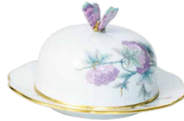
vajtartó 393-0-17 Email Victoria fleur (EVICTF2)

A kínai hagyományban a lepkék a halhatatlanságot jelképezik, mivel a taoizmus a szárnyakat az öröklet kifejezésének tartja. A gyönyörű pillangók díszes szárnyaikkal, szépségükkel a könnyedséget, csapongó repkedésükkel pedig a lélek fejlődését szimbolizálják, amit a Viktória-mintás porcelánon tökéletesen egészít ki a többi dekorációs elem.