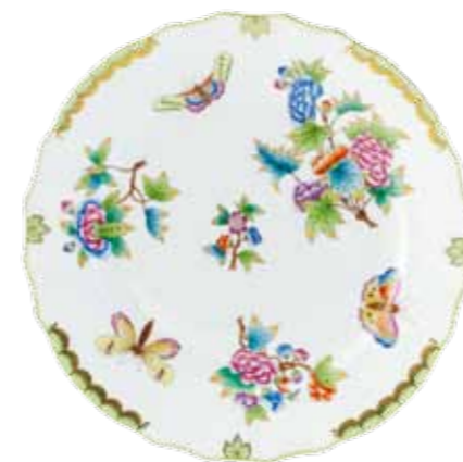
Victoria avec bord en or (VBO)