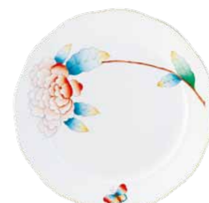
Pivoine rose, Héderváry-színnel (PIRO1H)