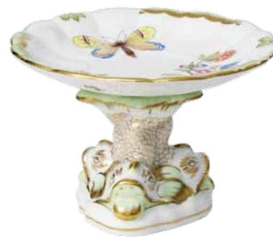
dísztálka 7557-0-00 Victoria avec bord en or (VBO)