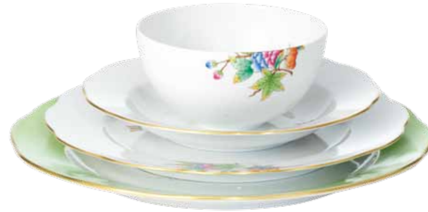
müzlis tálka 2365-000 Victoria courte (VC), mélytányér 20504-0-00, lapostányér 20527-0-00 Petite Victoria (PV) és terítékányér 20156-0-00 E-508