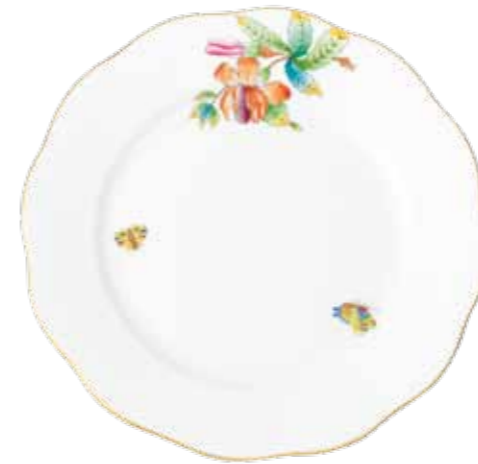
desszertányér 20517-0-00 Petite Victoria (PV)