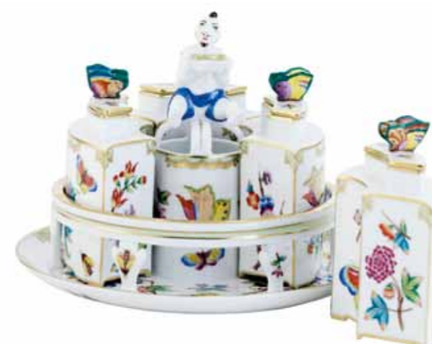
teatartó dobozok tálcán 6370-0-21 VICTORIA