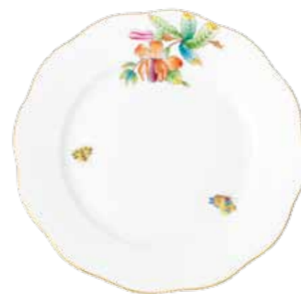
Petite Victoria (PV)