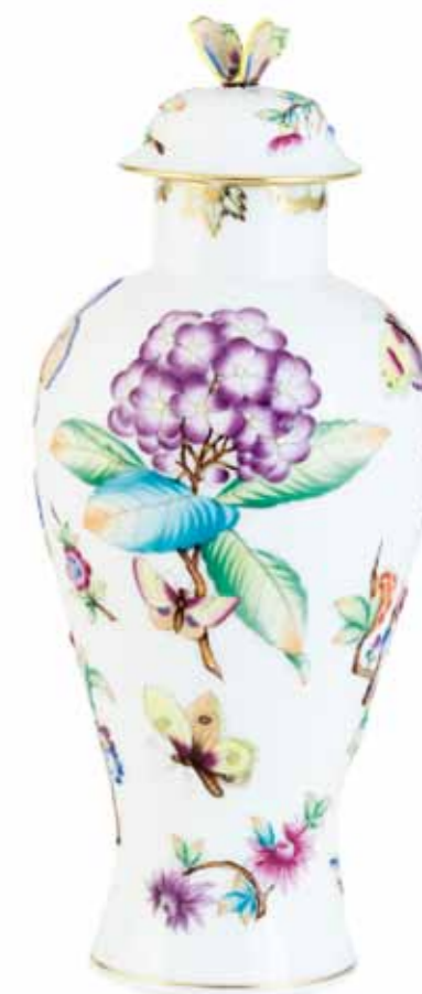
váza lepkefogóval 7135-0-17 SP395