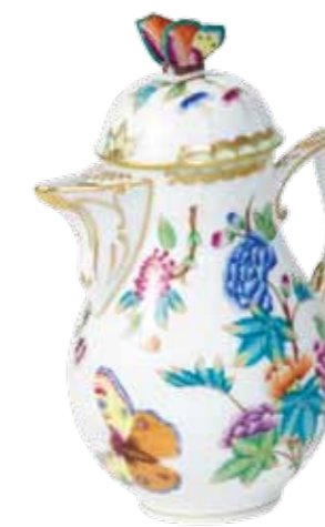
csokoládéskanna 624-0-17 VICTORIA