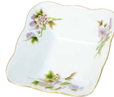
salátástál 186-0-00 Email Victoria fleur (EVICTF1)