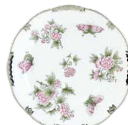
Victoria gris avec bord platine (VBOG-X1-PT)