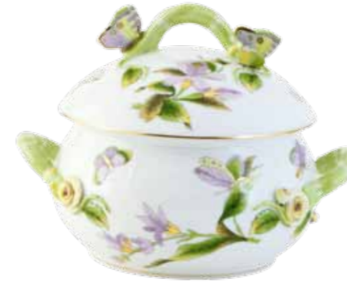
levestál ágfogóval, lepke díszítéssel 00025-0-17 Email Victoria fleur (EVICTF1)