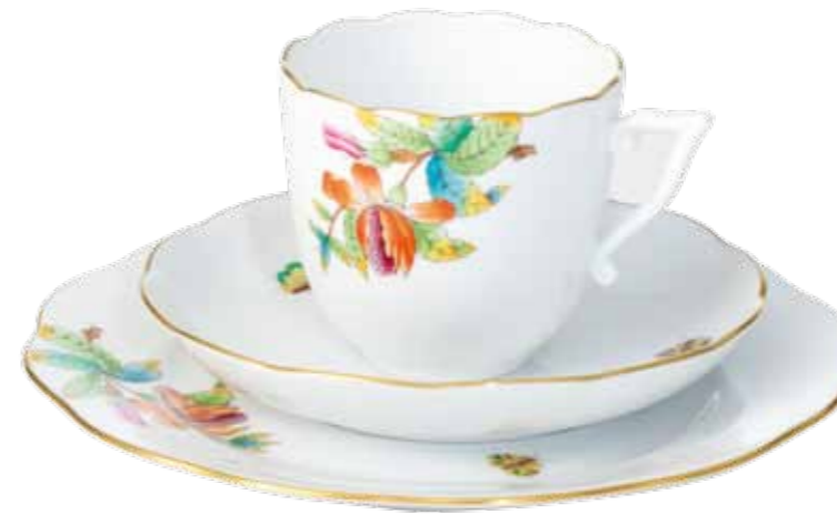
kávéscsésze alsóval 20706-0-00 és desszertányér 20517-0-00 Petite Victoria (PV)