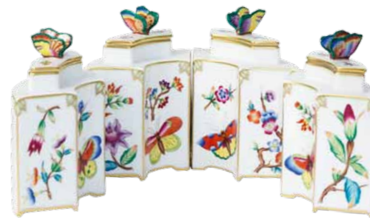
teatartó dobozok 6370-0-21 VICTORIA