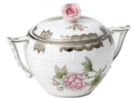
cukortartó rózsafogóval 472-0-09 Victoria gris avec bord platine (VBOG-X1-PT)