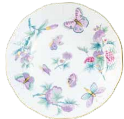
lapostányér 524-0-00 Email Victoria (EVICT2)