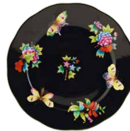
Victoria email, fond noir (VE-FN)