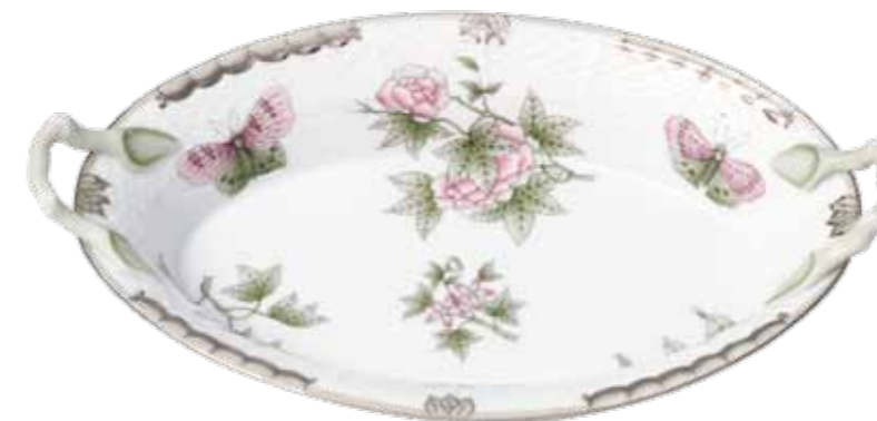
kenyérkosár 380-0-00 Victoria gris avec bord platine (VBOG-X1-PT)