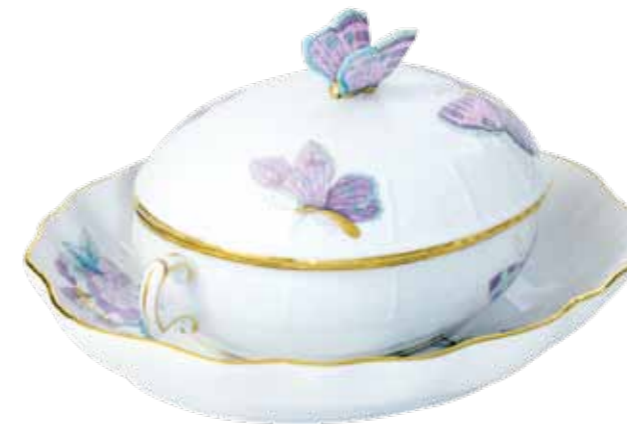
dzsmentartó 370-0-17 Email Victoria papillon (EVICTP2) és tálka 212-0-00 Email Victoria fleur (EVICTF2)