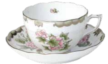
teáscsésze alsóval 701-0-00 Victoria gris avec bord platine (VBOG-X1-PT)