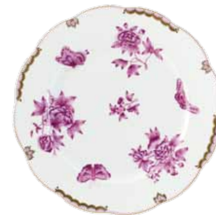
Victoria avec bord en or, lilas (VBOL)