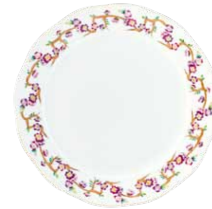
Printemps de Victoria (PDVICT1)