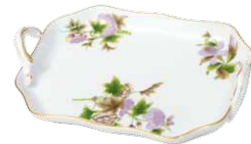
tálca 422-0-00 Email Victoria fleur (EVICTF1)