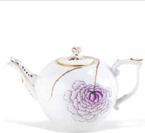
teáskanna csavartfogóval 20604-0-06 Pivoine rose, lilás (PIRO2L)