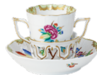
csokoládécsésze 712-1-00 és csészezsó 712-1-00 VICTORIA