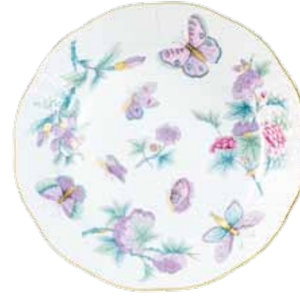
Email Victoria (EVICT2)