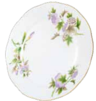
lapostányér 524-0-00 Email Victoria fleur (EVICTF1)