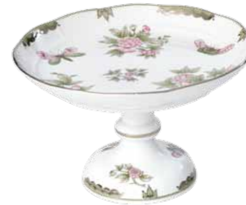
gyümölcstál 311-0-00 Victoria gris avec bord platine (VBOG-X1-PT)