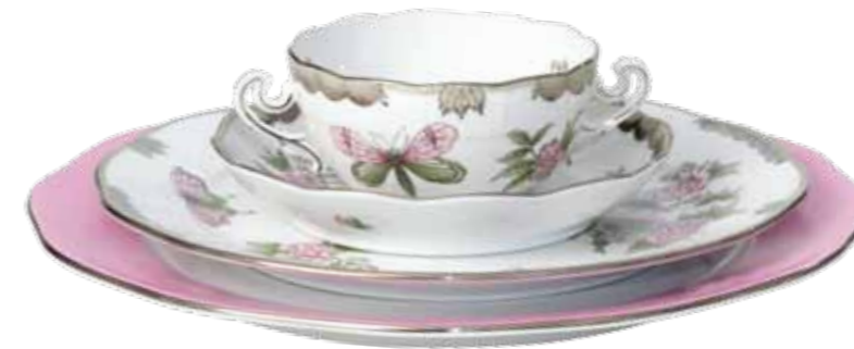
levescsésze 718-2-00 Victoria gris avec bord platine (VBOG-X1-PT), lapostányér 524-0-00 és terítéktányér 20158-0-00 CP63-PT

A Viktória-mintának aktuális trendszínekkel, a zöldezzürkével és a világos purpural átalakított változata. A stilizált peóniák, tulipánfák és cseresznye virágok ábrázolása kínai előképekből merít, és azok szimbólumvilágát használja. A szépség és gazdagság párosul itt a múlandóság jelképrendszerével. A szürke és purpur színárnyalathoz igazodik a platínával festett szegély. A mintának ez a variációja 2010-ben készült.