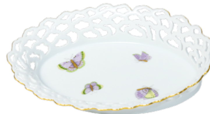
kenyérkosár 7357-0-00 Email Victoria papillon (EVICTP1)