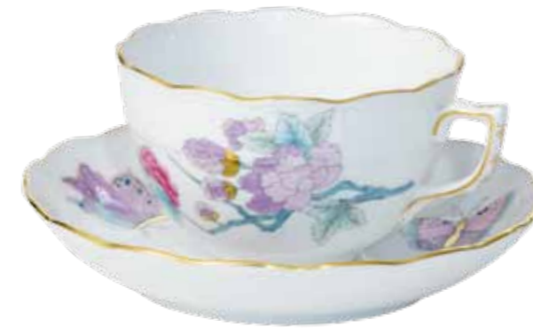
teáscsésze alsóval 701-0-00 Email Victoria (EVICT2)