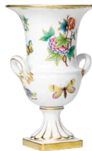
Empire váza, talpon 6431-0-00 Victoria avec bord en or (VBO)