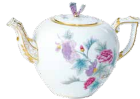
teáskanna pillangófogóval 606-0-17 Email Victoria fleur (EVICTF2)