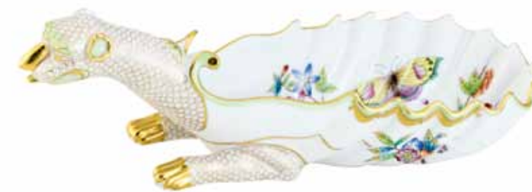
sárkány alakú díztál 7760-0-00 Victoria avec bord en or (VBO)